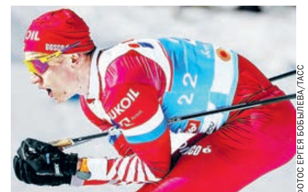
Наш Александр Большунов в первой гонке был лишь пятым.