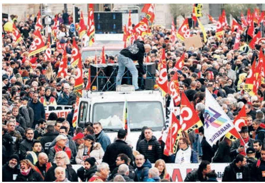
Вчера в Париже шли демонстрации, французы протестовали против всех и вся...

Le Figaro написала, что с 9 декабря 2019 года по 9 мая 2020 года «открывается уникальное окно возможностей для франко-русских отношений». Издание надеется, что в Париже с понедельника в рамках «нормандского формата» может начаться «окончательное урегулирование конфликта на Донбассе». «Объяснит ли Зеленский общую амнистию и культурную