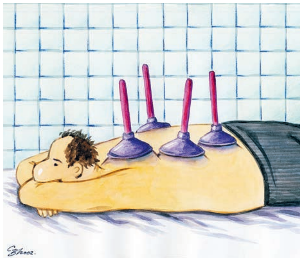
ИЛЛЮСТРАЦИЯ ВЛАДИМИРА СЕМЕРЕНКО (ARTSTORYBANK.RU)