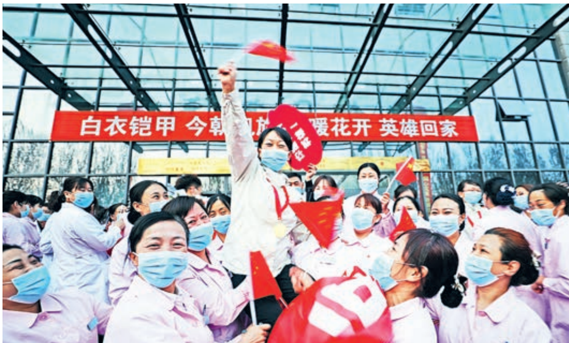
Медицинский персонал автономного района Внутренняя Монголия вернулся из Уханя домой.

«Блокировка» Уханя. После вспышки эпидемии в провинции Хубэй 23 января ЦК КПК издал указ о запрете выезда жителей из Уханя и провинции