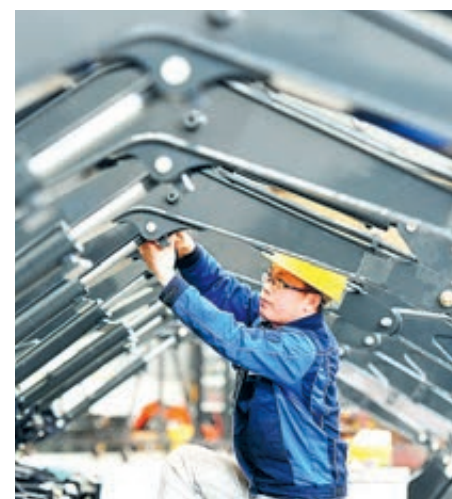
Провинция Хунань восстановила производство после эпидемии, срочно выполняет зарубежные заказы.

Страны Запада также готовятся к стимулированию экономики и восстановлению производства. Инфраструктурное строительство и возобновление производства в западных странах будет способствовать росту экономики. Это также возможность для Китая.