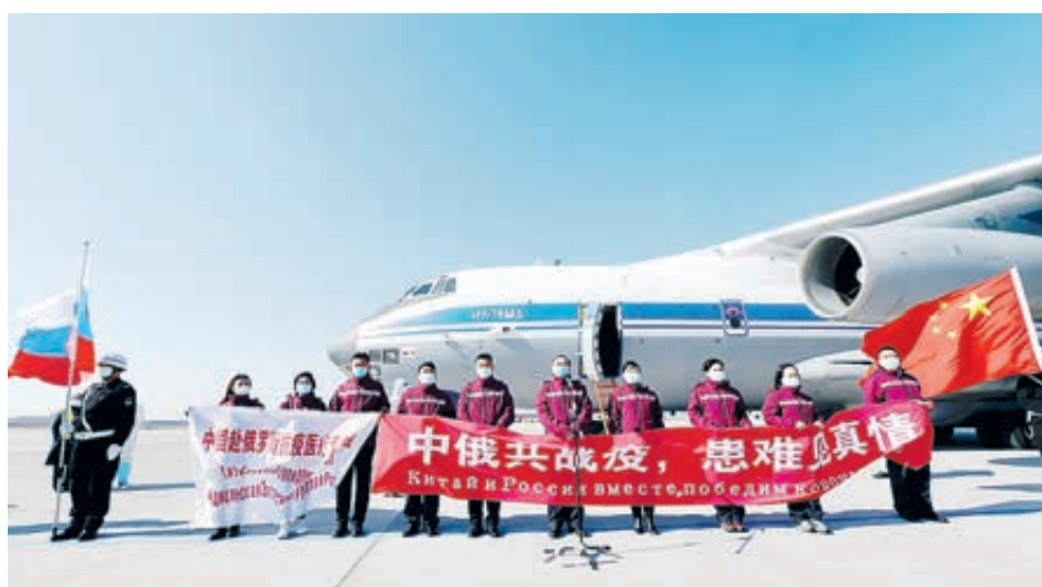
Китай направил в РФ группу экспертов для борьбы с COVID-19.

Правда: Институт вирусологии Уханя не имеет никакого отношения к возникновению нового типа коронавируса. Государственная лаборатория по биологической безопасности Института вирусологии Уханя Китайской академии наук обладает сертифицированным уровнем защиты P4 (в Европе это уровень BSL-4). Она способна работать со смертельными возбудителями заболеваний. Эта лаборатория расположена в 30 км от центра Уханя, вирус не может просочиться из лаборатории с таким высоким уровнем безопасности.