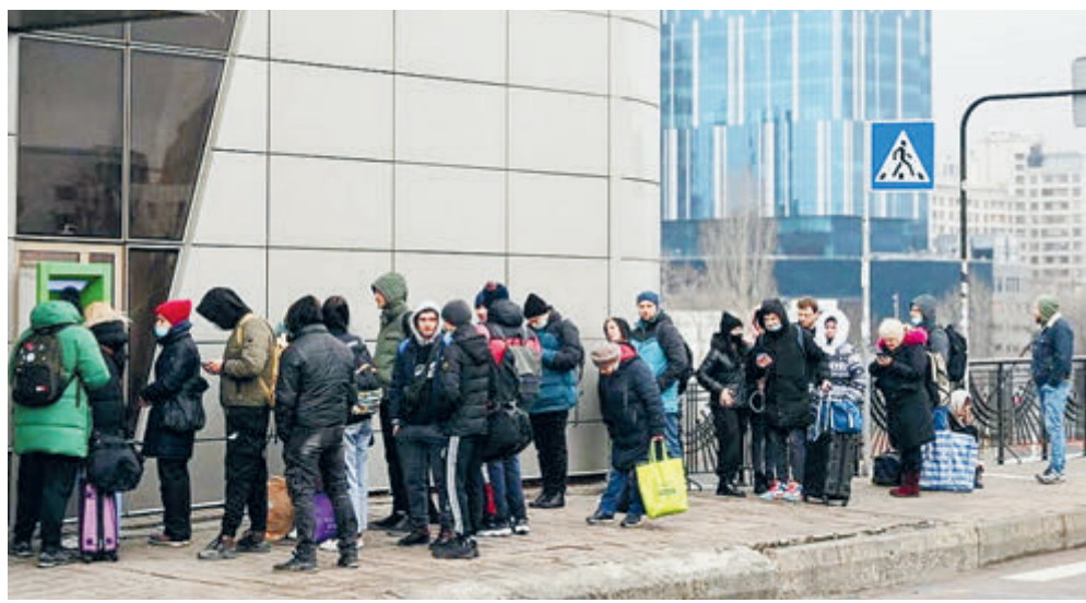
В Москве выстроились очереди к банкоматам.

А еще эти деньги можно было вложить в создание современной электронной промышленности – как во Вьетнаме, которому Intel всего за 1,5 млрд долларов по-