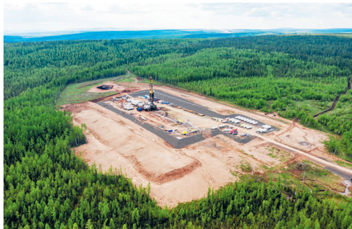
Низкие удельные затраты на добычу, а также минимальный углеродный след делают «Восток Ойл» самым экологичным проектом по добыче углеводородов современности

То, что нефтяная компания уделяет большое внимание масштабной высадке деревьев в регионах присутствия, совсем не удивительно. Лес – это естественный поглотитель парниковых газов и эффективный инструмент декарбонизации. Лесоклиматические проекты достаточно давно реализуются за рубежом, разработан большой массив международных стандартов и систем сертификации. Но в России это направление пока не очень развито, и на сегодняшний день есть