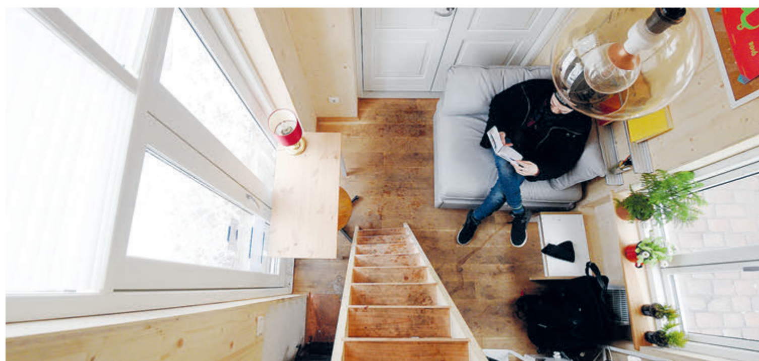
Между прочим, «домики Тыквы» встречаются и в Германии.

с. 1 Рынок адаптируется под запросы массового покупателя, который готов приобретать загородные дома по цене одно- и двухкомнатных квартир. А самый быстрый и эффективный способ снизить себестоимость строящегося жилья – это урезать на несколько «квадратов» каждую комнату.