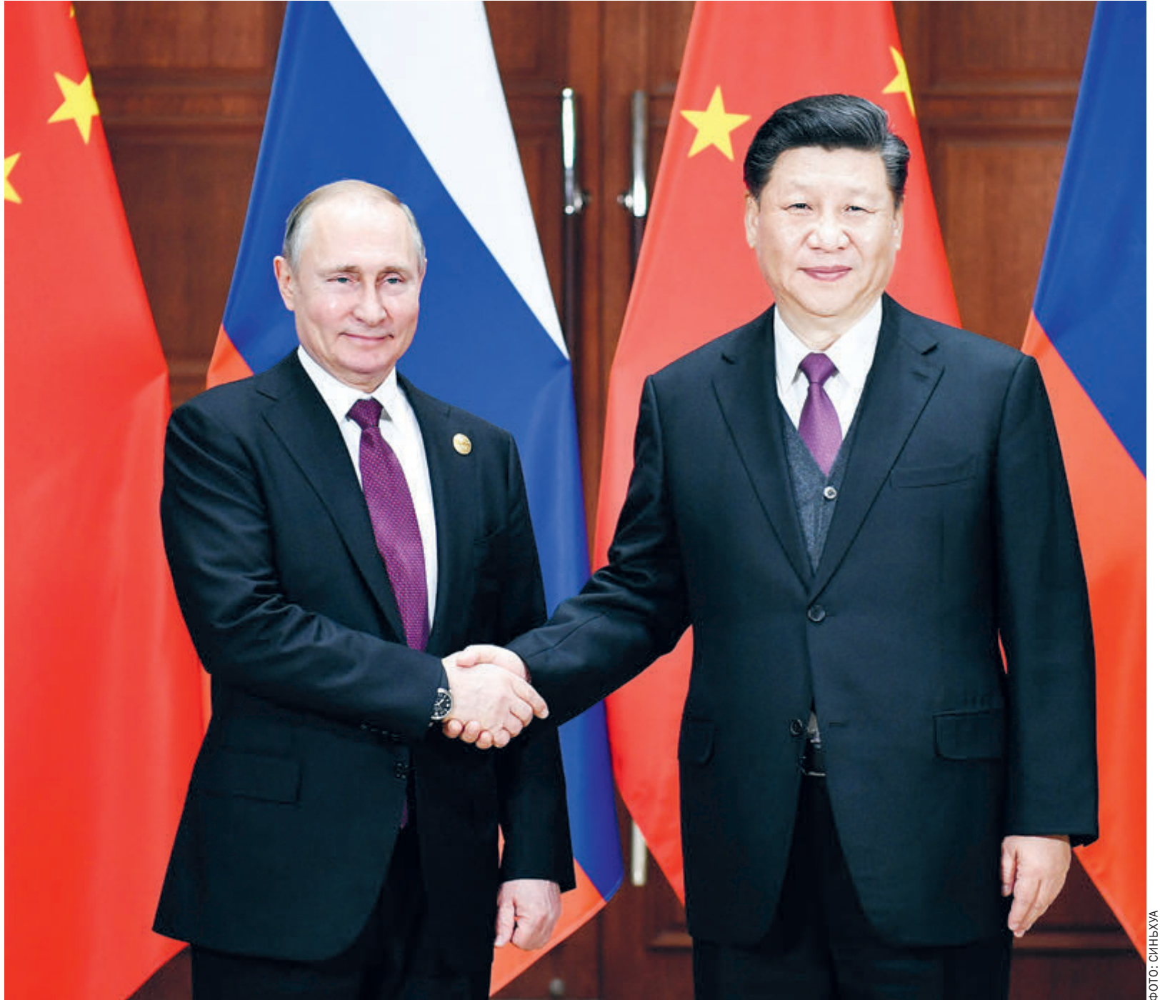
Председатель КНР Си Цзиньпин и президент РФ Владимир Путин.

В-третьих, глубоко и значительно укрепилась экономическая безопасность.