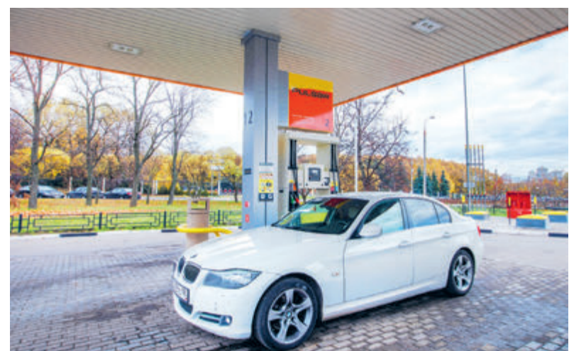
На АЗС «Роснефти» реализуется топливо Pulsar 100 и Евро-6 с улучшенными экологическими характеристиками.

Важным направлением работы «Роснефти» является улучшение характеристик выпускаемых моторных топлив и увеличение продаж продуктов с улучшенными экологическими характеристиками. Среди линейки подобных видов топлива на рынке выделяется высокооктановое топливо Pulsar 100 и Евро-6 на базе АИ-95. Сеть АЗС «Роснефти» на сегодня является одной из самых больших в стране и насчитывает около 3 тысяч станций. Между тем компания реализует проекты по развитию сети автозаправочных станций с компримированным природным газом и оснащению АЗС зарядной инфраструктурой для электромобилей.