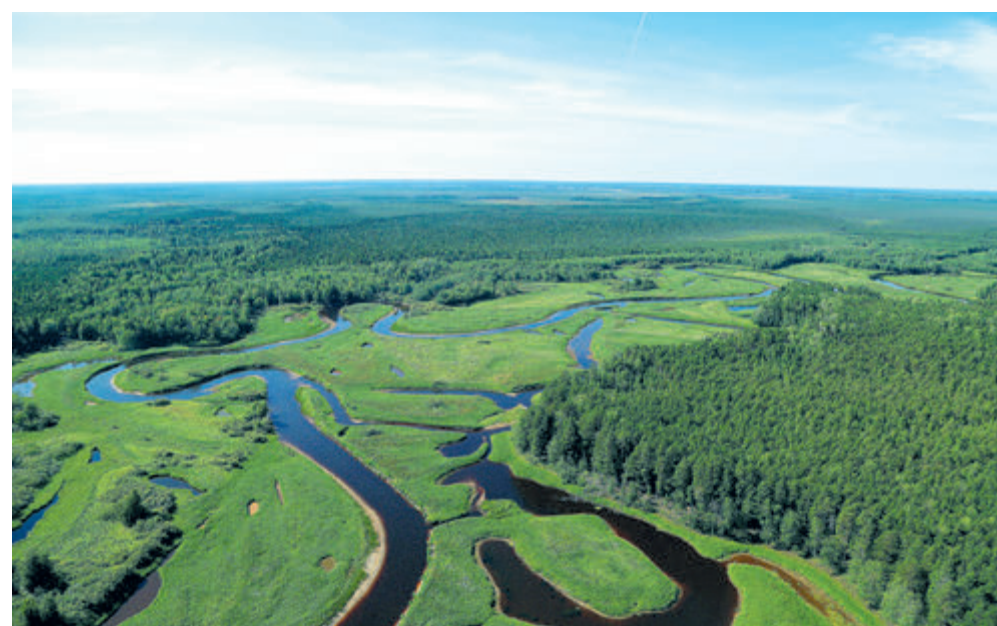
Российские леса ежегодно поглощают от 200 миллионов тонн углерода. Вклад нового проекта «Роснефти» составит порядка 5% от общего потенциала лесов страны.