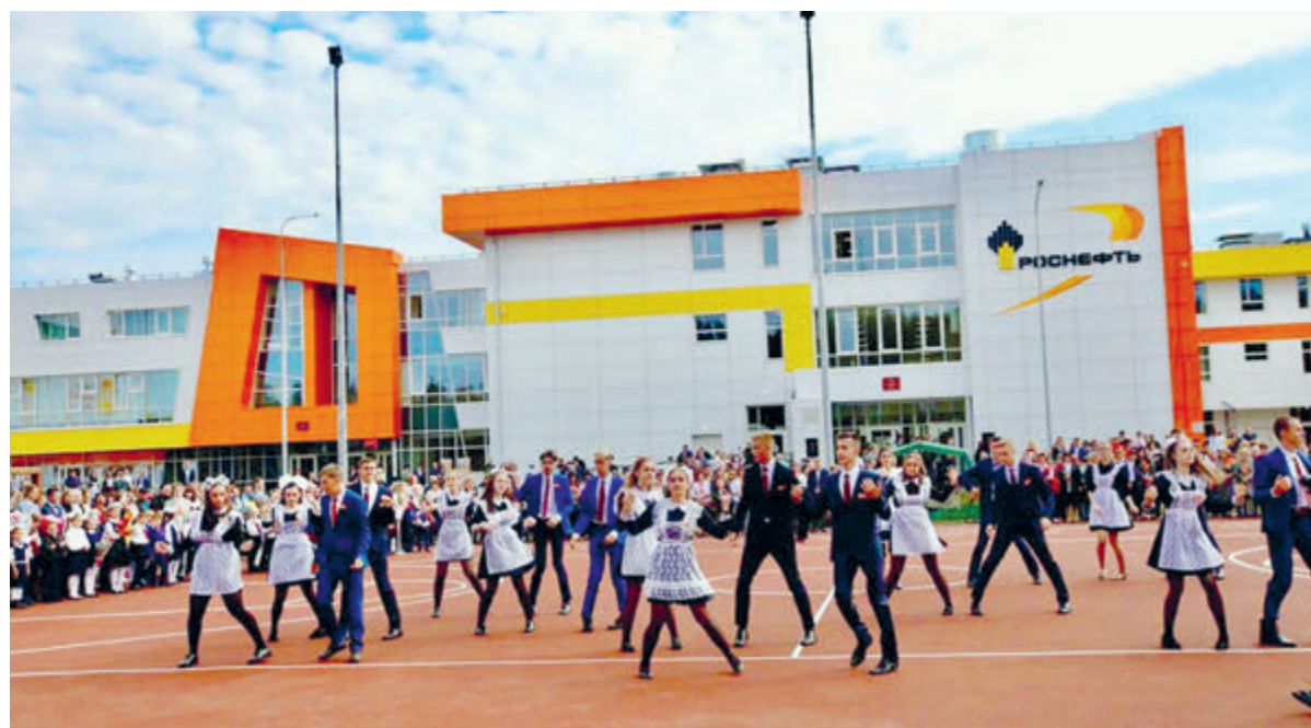
«Роснефть» в рекордные сроки – за 300 дней – построила и полностью оснастила школу «Новая Эра».

Одной из точек роста школы станет повышение квалификации руководителей и педагогического коллектива. В период летних каникул вся административная команда и педагогический состав – более 60 человек – прошли курсовую подготовку. Уже 79% учителей школы имеют квалификационные категории, что повысило показатели образовательного процесса. Например, качество обучения в классах углубленного изучения и профильных классах составляет 84,2%. Учащиеся «Новой Эры» показывают высокие результаты сдачи Единого государственного экзамена. В прошедшем учебном году среди выпускников «Новой Эры» – 73 отличника, восемь