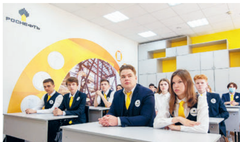
В прошлом учебном году 975 учащихся «Роснефть-классов» стали победителями и призерами олимпиад различных уровней.

Подготовка высококвалифицированного кадрового резерва, как отмечают в «Роснефти», является важнейшей задачей. За последнее время современная