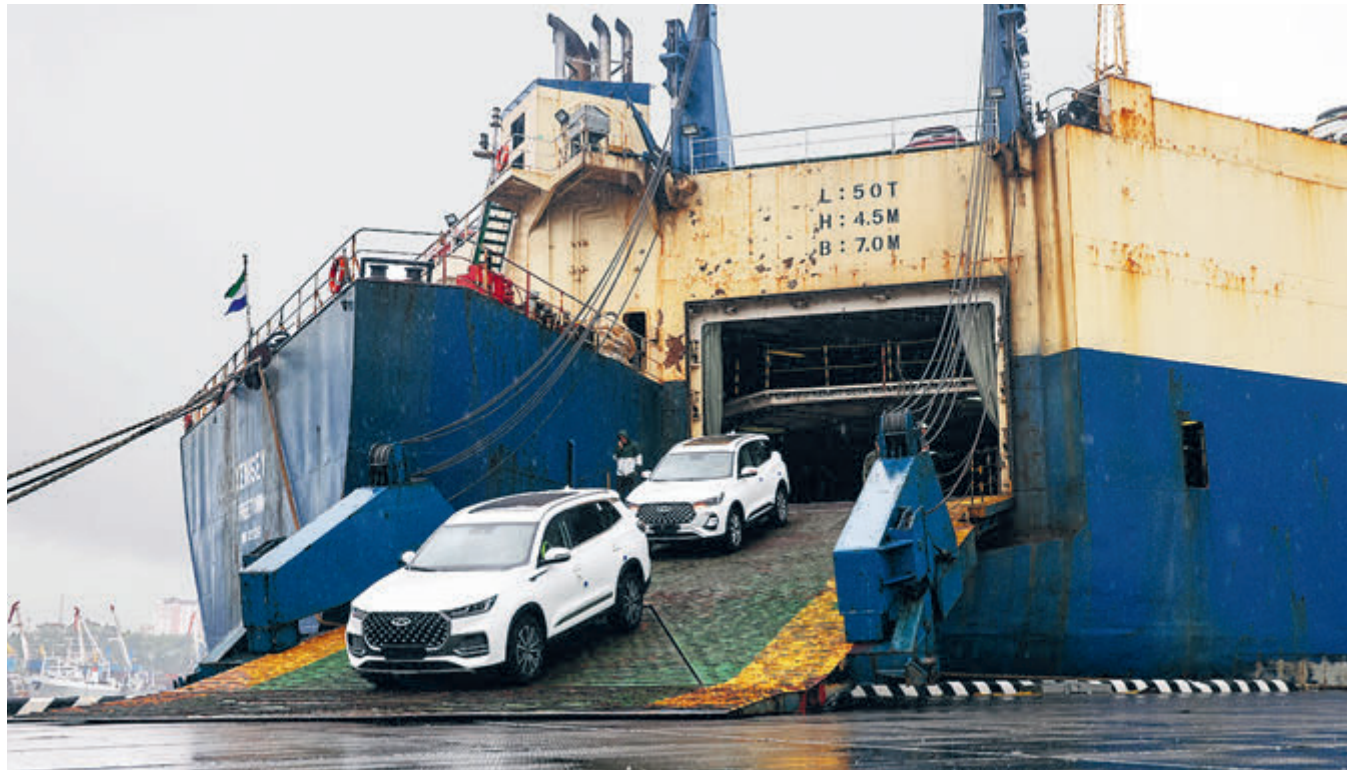
Владивосток. Китайские автомобили прибыли в Россию.

Однако предложение новых автомобилей на белорусском рынке быстро иссякло. Основная причина – логистика. Многие белорусские дилеры получали автомобили с российских заводов, которые теперь в основном остановлены. Организовать новые