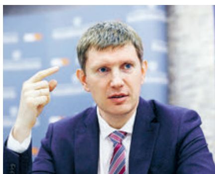
Светлое будущее от генсеков и министра.

Глава Минвостокразвития Алексей Чекунков зовет Россию инвестировать в образование и заложить базу «на десятилетия для подготовки «людей будущего». Но для победы в гибридной войне и развороте на Восток он предлагает для начала вернуться к истокам, а именно к постулатам китайского мыслителя Сунь-цзы, описанным в трактате «Искусство войны». Эта мысль стара, как Конфуций или как идея поддержать российское образование, которое в результате бесконечных реформ по западным образцам деградировало до уровня ЕГЭ.