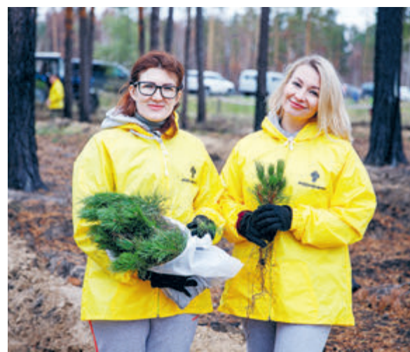
Более 16 млн деревьев высадили специалисты «Роснефти» за последние пять лет.