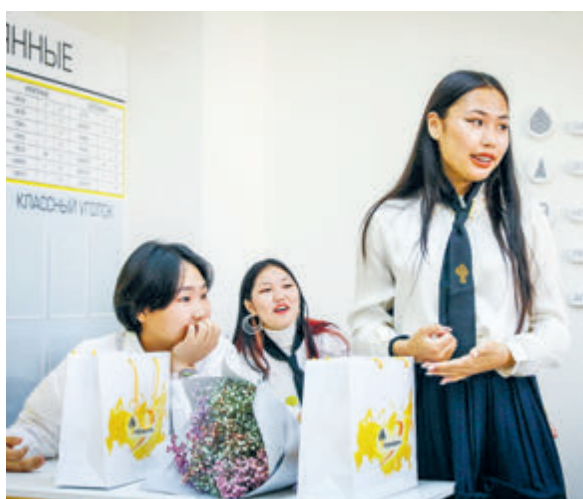
Более 1200 детей обучаются в тулунской школе «Новая Эра».

нефтегазовая отрасль превратилась в технологичное производство, которое требует фундаментальных знаний. Для этих целей «Роснефть» вот уже на протяжении нескольких лет реализует корпоративную систему непрерывного образования «школа – вуз – предприятие». Ее основная задача – профориентация и усиленная подготовка школьников к поступлению в профильные технические университеты страны. Это способствует формированию кадрового резерва и обеспечивает постоянный приток качественно подготовленных моло-