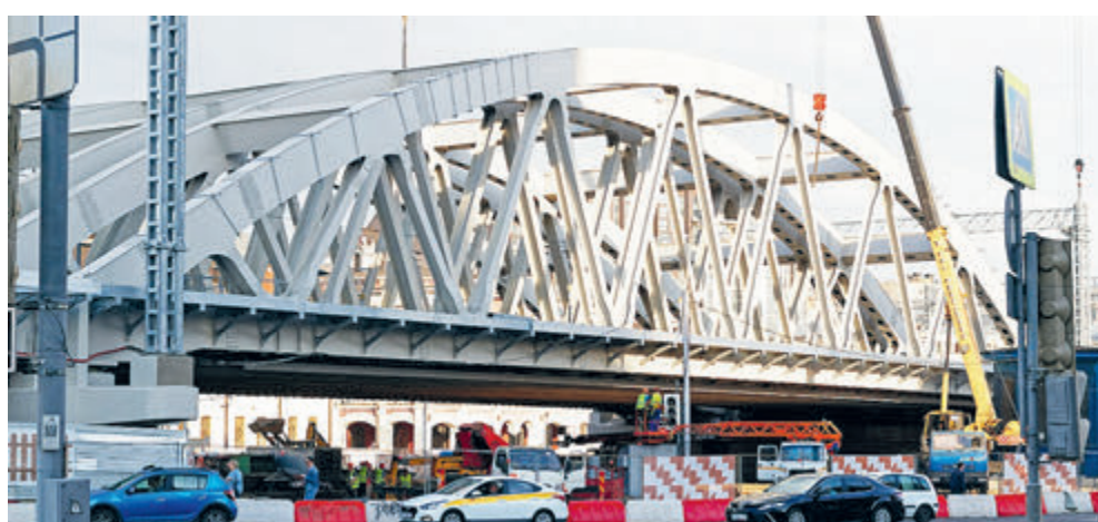
Щусевский виадук в 2018-м (вверху), на рисунке архитектора в 1910-м, на фото 1946 года и сейчас (внизу).

Увы, теперь правильнее будет сказать: оттенял. Потому что при реконструкции путепровода, который расширили в связи с созданием системы Московских центральных диаметров, от творения Щусева осталось лишь воспоминание. К юбилею зодчего при участии ОАО «Российские железные дороги» и правительства Москвы Каланчевский виадук, по сути, был уничтожен. Причем, как подчеркивают кураторы движения «Архнадзор», историю