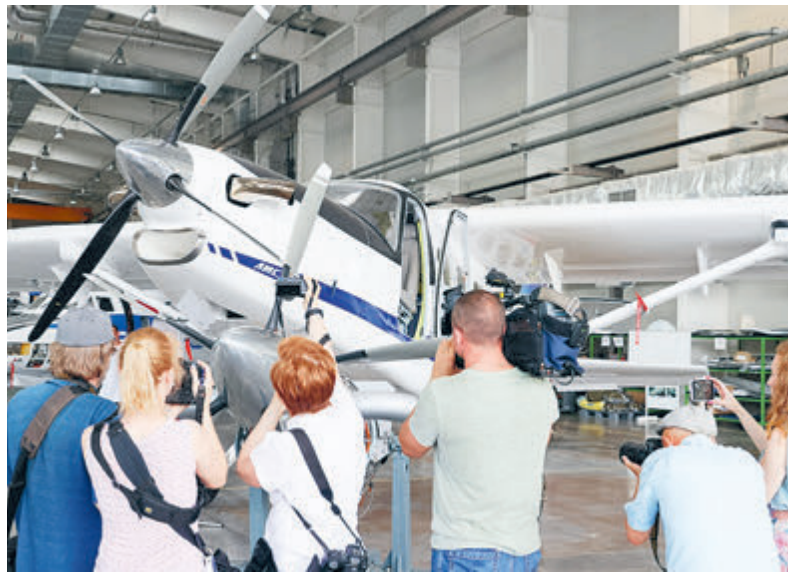
Легкий российский самолет ЛМС-901 «Байкал» заждались в небе.

В начале октября этот казус случился и с самолетом ЛМС-901 «Байкал», который давно готовится к выпуску на Уральском заводе гражданской авиации. Производитель сообщил, что с 2021 года стоимость самолета выросла на треть и сегодня составляет 178 млн рублей. Причем это цена в базовой комплектации, за дополнительные опции покупателям придется заплатить еще 117 млн.