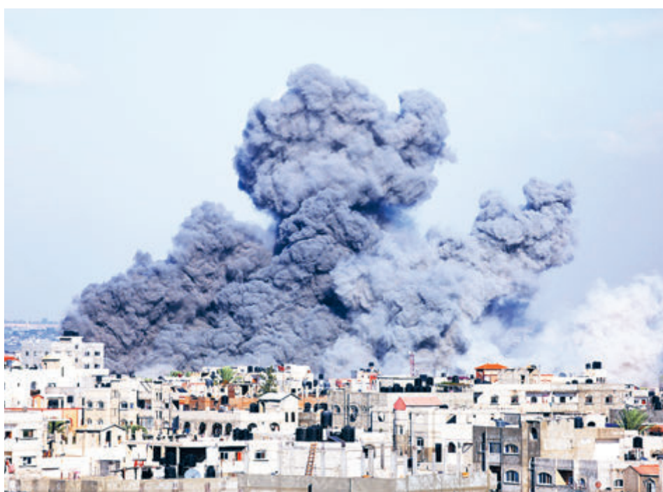
«Железный меч» над сектором Газа.

авианосца с группой эсминцев в Восточное Средиземноморье. Вашингтон при этом грозит пальцем всем, кто готов прийти на помощь ХАМАС, – речь идет о «Хезболле», Сирии и Иране, в котором глава Белого дома видит главную угрозу интересам США и Израиля.