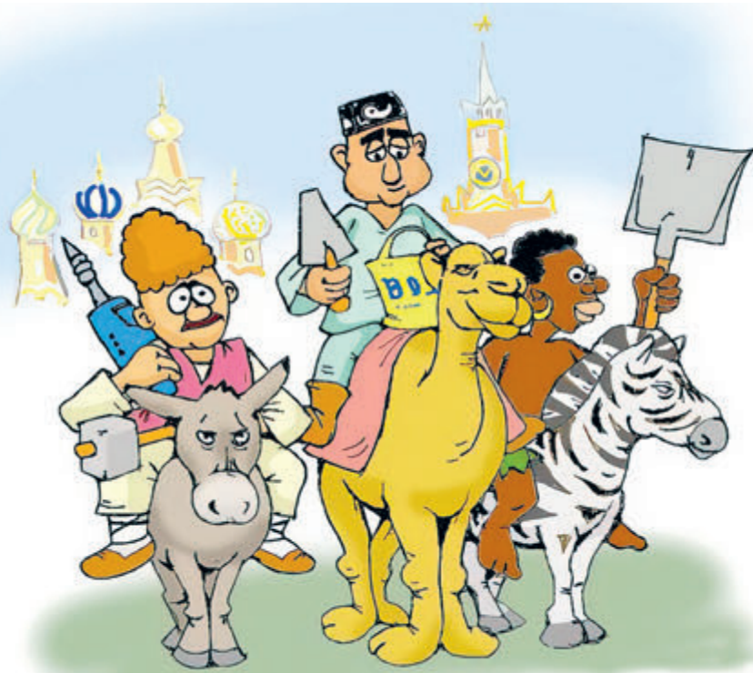
ИЛЛЮСТРАЦИЯ САРГОЦУРА. RU

до 70 млн (включая «обрусевших» гастарбайтеров) снизилось в стране количество работающих россиян в последние два десятилетия