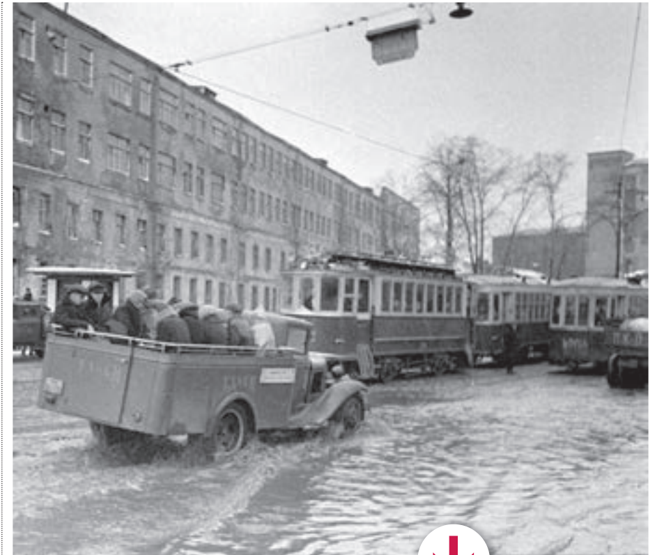
1947 год. По улице Стромынке едет первая маршрутка (7) — В начале 30-х в Москве появились первые такси, а потом придумали маршрутки. Как дешевый, альтернативный вариант «доставки» людей. Надеюсь, скоро мы от маршруток откажемся вовсе. А чтобы они исчезли, пусть как по часам ходят автобусы и трамваи, — говорит историк, автор нескольких книг об истории Москвы Александр Мясников. 30 сентября 2015 года. Маршрутка остановилась на транспортно-пересадочном узле «Сходненская» (8)