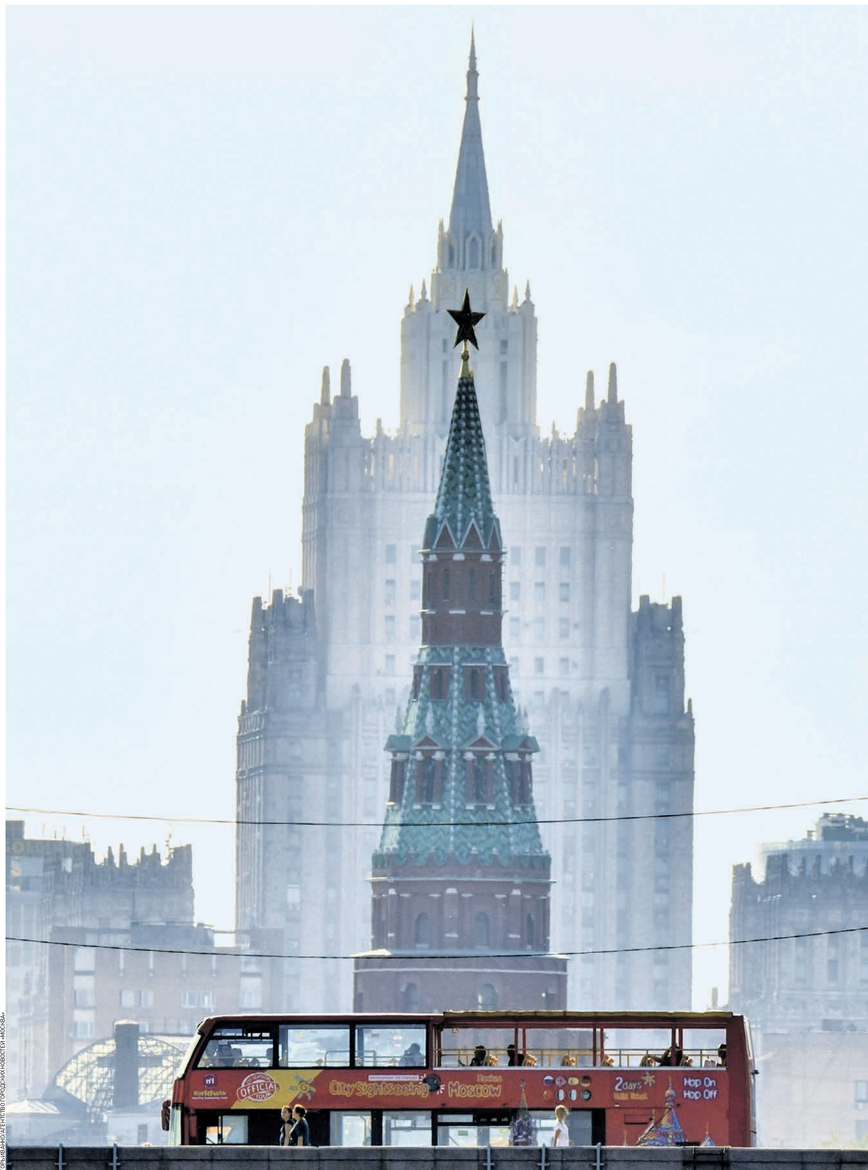
31 мая 2019 года. Центр Москвы. Эксперты уверены: сначала необходимо полностью благоустроить уже существующую территорию и лишь потом думать о новом расширении