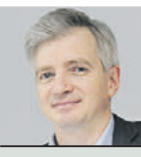
АЛЕКСАНДР ИЛЮХИН МИНИСТР ПРАВИТЕЛЬСТВА МОСКВЫ, ГЛАВА СТОЛИЧНОГО ДЕПАРТАМЕНТА КУЛЬТУРЫ

Почему это важно? Потому что такой проект позволяет увидеть тенденции, которые наметились в современном искусстве. Ведь Москва — крупнейший мировой мегаполис не только с точки зрения экономики, транспорта или промышленности, мы занимаем лидирующие позиции и в сфере культуры. У нас огромная творческая повестка: каждый день в городе в среднем открывается четыре выставки, проходит 800 тысяч различных творческих мероприятий в год. И во всем этом многообразии необходимо уловить векторы дальнейшего развития того или иного вида искусства. Московская международная биеннале — один из проектов, позволяющих заглянуть за горизонт. Увидеть не только то, что у нас есть сейчас, но и познакомиться с творчеством молодых ребят, которые, как знает, через несколько лет, возможно, станут одними из выдающихся художников мирового уровня.