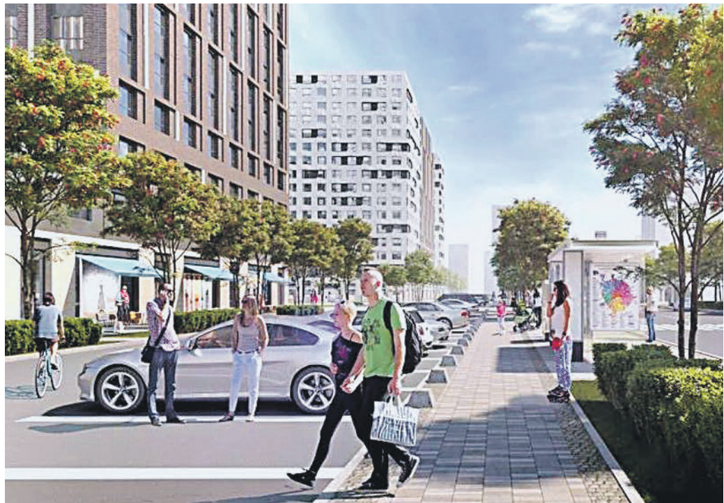
Проект реновации квартала в районе Северное Измайлово: вдоль проезжей части планируется высадить деревья, а плоскостные парковки разместить по внешнему периметру жилых домов