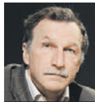
ГЕОРГИЙ БОБТ ОБОЗРЕВАТЕЛЬ

Мнение колумнистов может не совпадать с точкой зрения редакции «Вечерней Москвы»