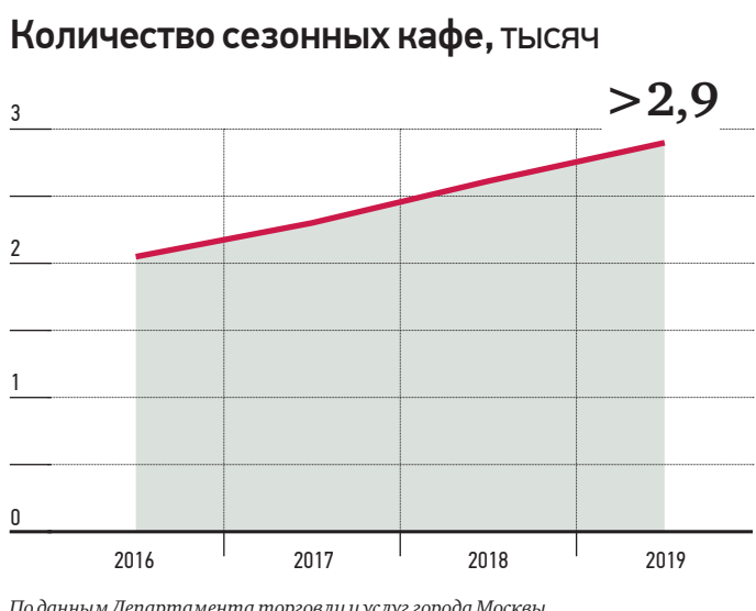
По данным Департамента торговли и услуг города Москвы