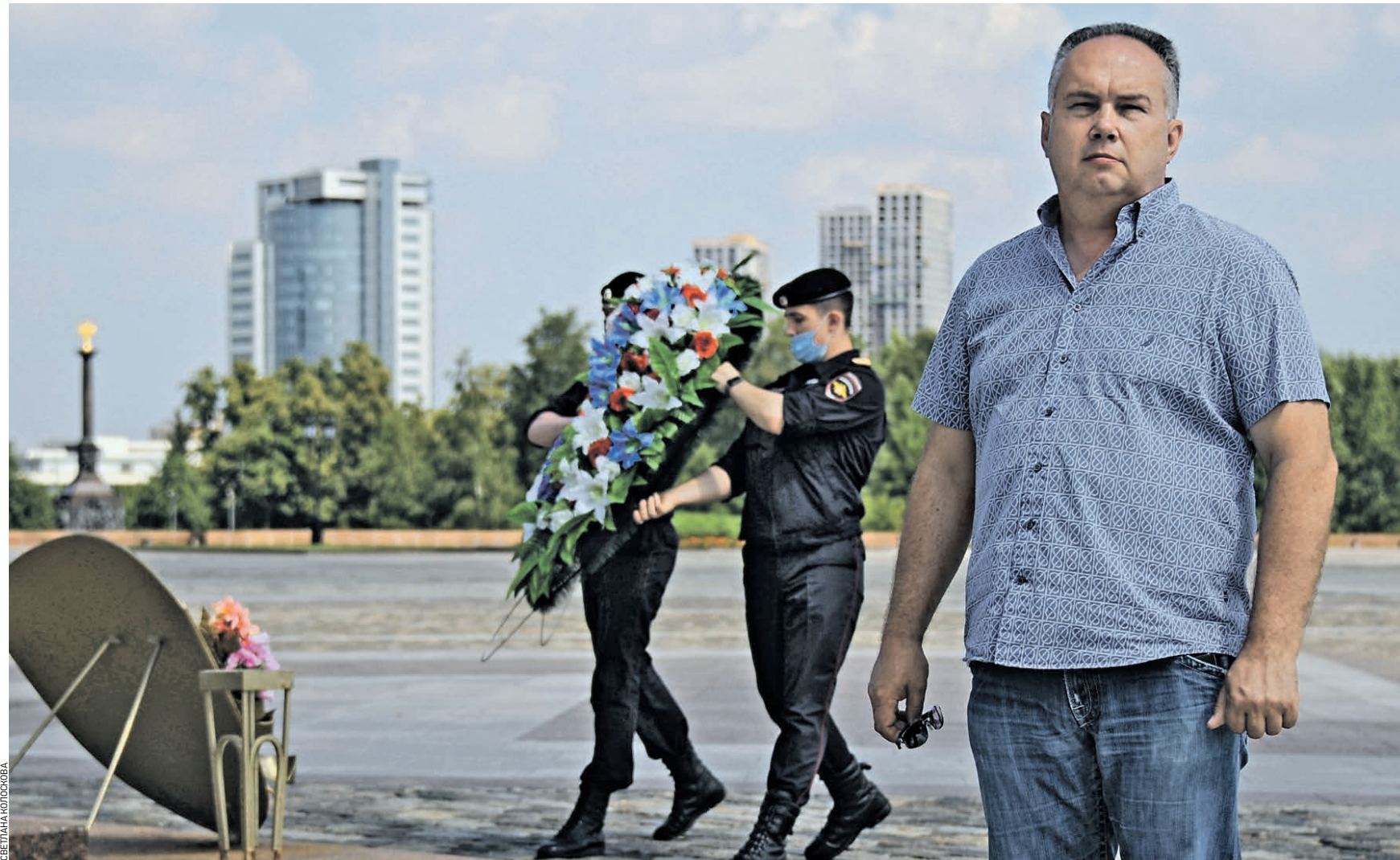
Вчера 11:20 Президент Военно-технического общества Алексей Мигалин на Поклонной горе во время возложения цветов к Вечному огню в рамках репетиции старта бронепробега от Москвы до Белгорода

— В этом году мы отправляемся в бронепробег в четвертый раз, — говорит она. — Первый раз поехали в 2017 году до Бреста. Тогда пробег был посвящен годовщине начала Великой Отечественной войны. Та поездка попала в Книгу рекордов России как самый длинный бронепробег в мире: десять бронетранспортеров прошли 2000 километров. Участвовал в нем и корреспондент «ВМ». — Я считаю, что такие мероприя-