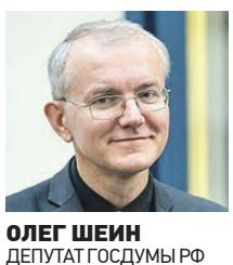
ОЛЕГ ШЕИН ДЕПУТАТ ГОСДУМЫ РФ

Я считаю, что это хорошая идея. Модель определения людей, с которыми контактировал заразившийся коронавирусом, уже применяется в мире. Например, очень эффективно она зарекомендовала себя в странах Восточной Азии. Использование системы наблюдения за больными с помощью сотовых позволяет избежать серьезного роста заболеваемости и в Южной Корее, и в индокитайских странах. На постсоветском пространстве этот метод успешно реализуется у наших соседей в Казахстане. Как известно, они не так сильно пострадали от коронавируса, как Российская Федерация. Число заболевших на душу населения в этом государстве намного ниже, чем в России. Контроль за пациентами с таким диагнозом очень четкий и обеспечивается за счет применения электронных систем. Поэтому я полностью согласен с решением Минкомсвязи о необходимости введения подобной меры наблюдения за заразившимися. Правда, реализовывать этот проект нужно было намного раньше, еще весной. Скорее всего, это помогло бы избежать такого широкого распространения коронавируса среди населения, которое мы получили на сегодняшний день.