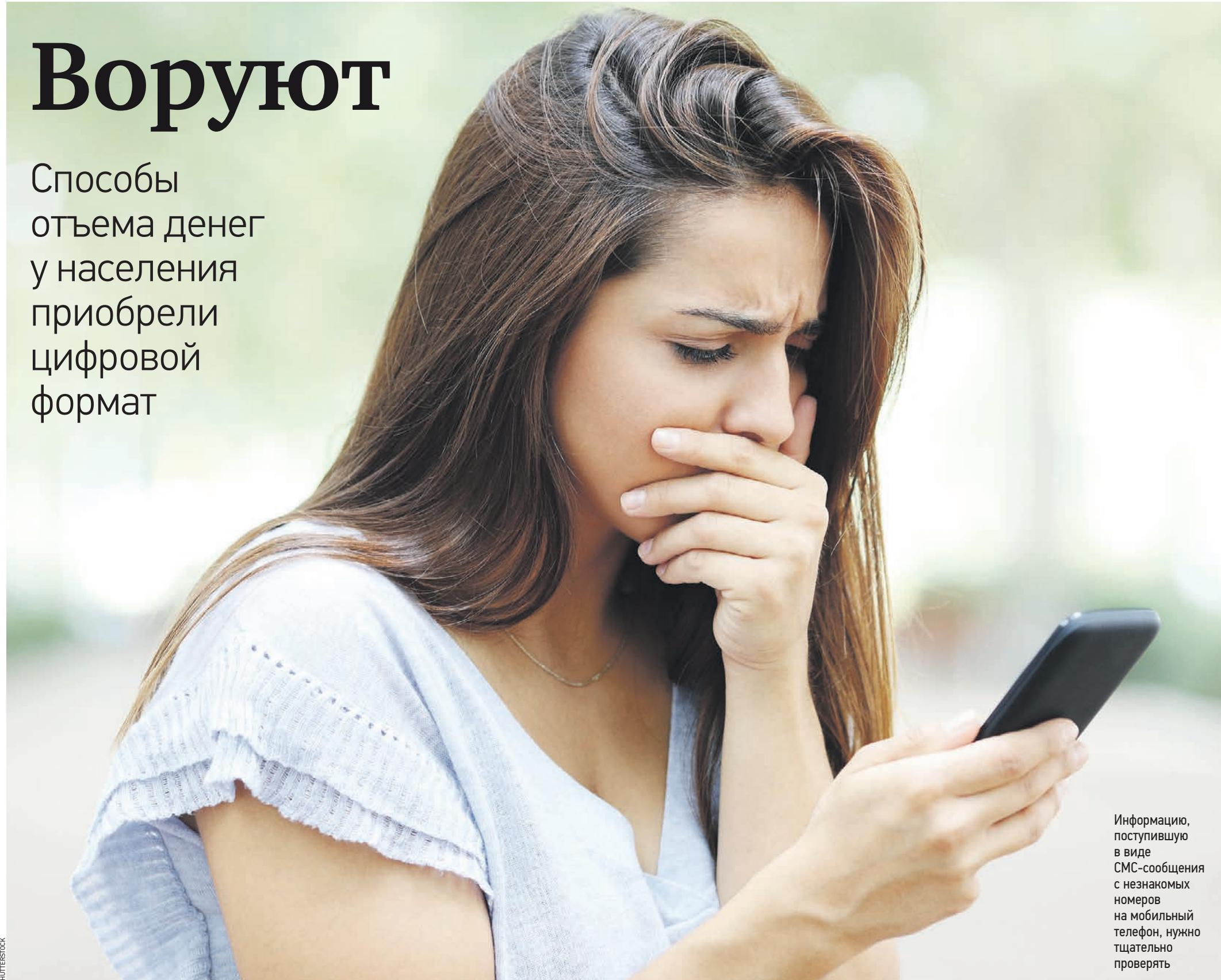
Информацию, поступившую в виде СМС-сообщения с неизвестных номеров на мобильный телефон, нужно тщательно проверять

Способы отъема денег у населения приобрели цифровой формат