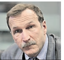
ГЕОРИЙ БОБТ ОБОЗРЕВАТЕЛЬ

Мнение колумнистов может не совпадать с точкой зрения редакции «Вечерней Москвы»