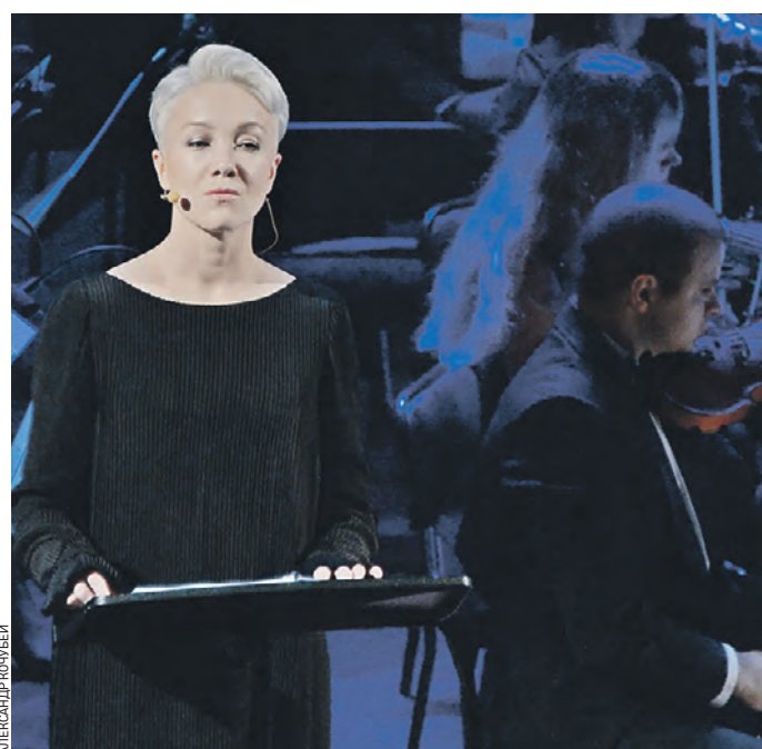
9 октября 19:35 Актриса Дарья Мороз в симфоспектакле «Мастер и Маргарита» на сцене Московской консерватории

В этом году фестивалю 20 лет, мы не могли представить, что он вырастет в такое большое, важное культурное событие. Этот год совпал с 250-летием со дня рождения великого композитора Людвиг ван Бетховена, поэтому многие концерты будут посвящены ему. Например, «Сумасшедший уик-энд Бетховена» в «Башмет-центре» или «Бетховен марафон» в парке «Зарядье».