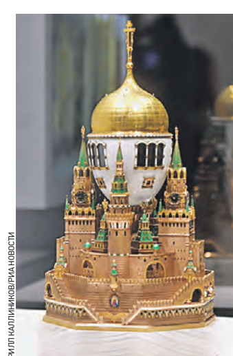
8 октября. Пасхальное яйцо «Московский Кремль»

В выставочных залах Успенской звонницы и Патриаршего дворца Музеев Московского Кремля открылась выставка «Карл Фаберже и Федор Рюкерт. Шедевры русской эмали».