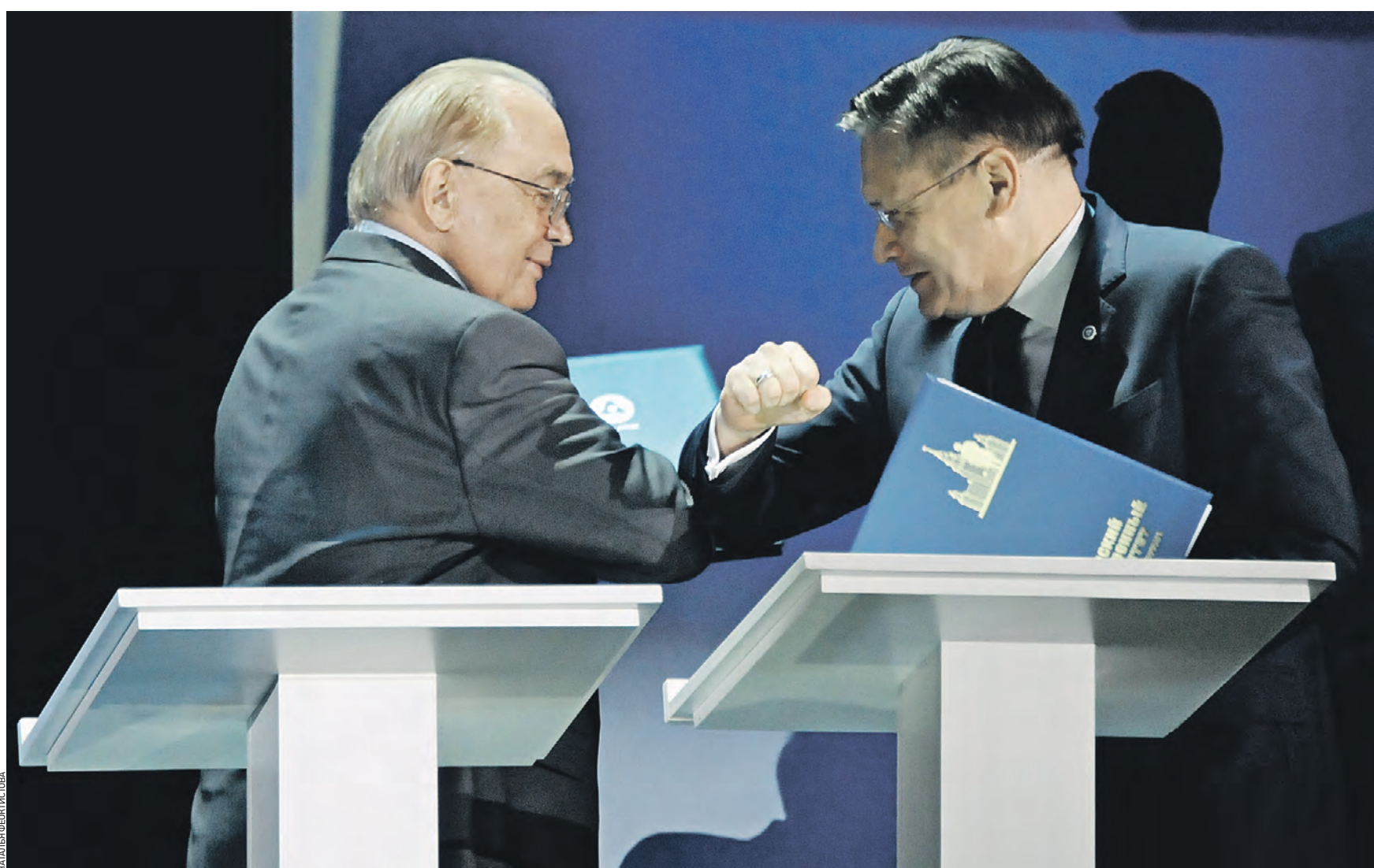
9 октября 18:08 Ректор МГУ имени Ломоносова Виктор Садовничий (слева) приветствует генерального директора корпорации «Росатом» Алексея Лихачева на церемонии открытия Всероссийского фестиваля НАУКА 0+. Эпидемическая ситуация заставила отказаться от привычных рукопожатий

— В Росатоме нужны разные профессии: и физики, и химики, и экономисты. Но лучшие.