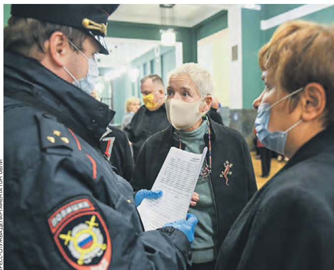
7 октября 20:24 Проверка соблюдения зрительскими предписаний Роспотребнадзора в театре «Ленком»