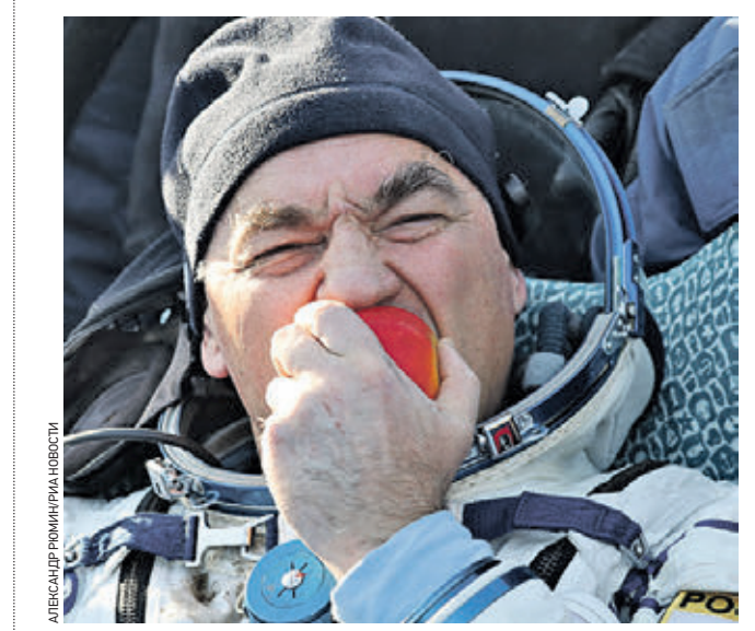
Вчера 12:46 Космонавт Александр Свирцов вместе с двумя членами экипажа экспедиции МКС-60/61 приземлился недалеко от города Жезказган в Казахстане. Встретили космонавтов шведскими рблками. «Посадка прошла штатно, — сообщил глава Роскосмоса Дмитрий Рогозин. — Спускаемый аппарат благополучно вернулся на Землю. На борту порядок, самочувствие экипажа удовлетворительное»