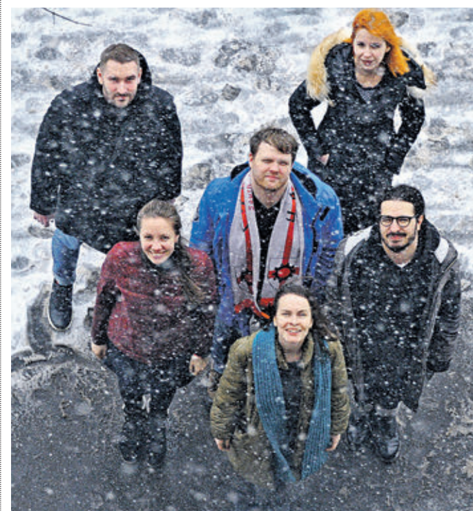
Корреспонденты «ВМ» АНДРЕЙ РЕЧМЕНСКИЙ, ДАРЬЯ ПИОТРОВСКАЯ, КИРИЛЛ ВАСИЛЬЕВ, ЮЛИЯ ДОЛГОВА, САМЕР МУСТАФА, ТАТЬЯНА ЕРЕМЕНКО