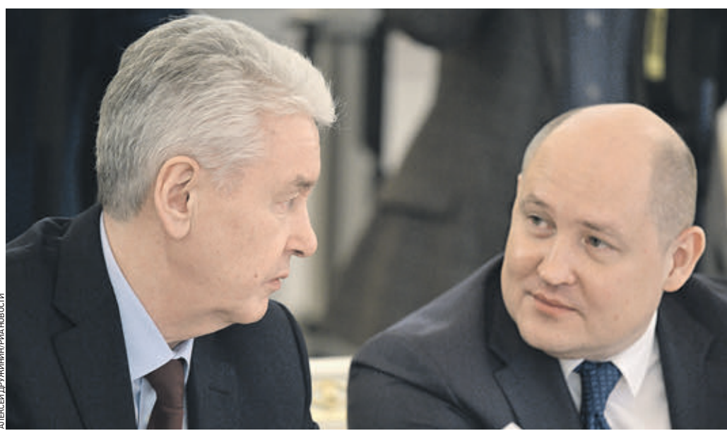
Вчера 15:18 Мэр Москвы Сергей Собянин (слева) и врио губернатора Севастополя Михаил Развозжаев перед началом расширенного заседания президиума Госсовета и Совета при президенте РФ по науке и образованию

— По всем этим направлениям нам нужно последовательно вести работу, чтобы поколения, которые растут сегодня в России, смогли раскрыть свой громадный потенциал, — сказал президент, предложив в начале следующего учебного года обсудить на Госсовете «развитие всего общего образования». На встрече же, которая прошла вчера, участники заседания сосредоточились на выработке мер по укреплению высшей школы в российских регионах. На этом направлении, по словам Владимира Путина, сделано немало. В частности, созданы сильные федеральные и национальные исследовательские университеты. Однако есть и проблемы. Одна из них — сверхконцентрация образовательных ресурсов в Москве и Санкт-Петербурге. — Здесь действует более 200 высших учебных заведений, — уточнил Путин. — Если не считать собственные региональные филиалы, то это вы-