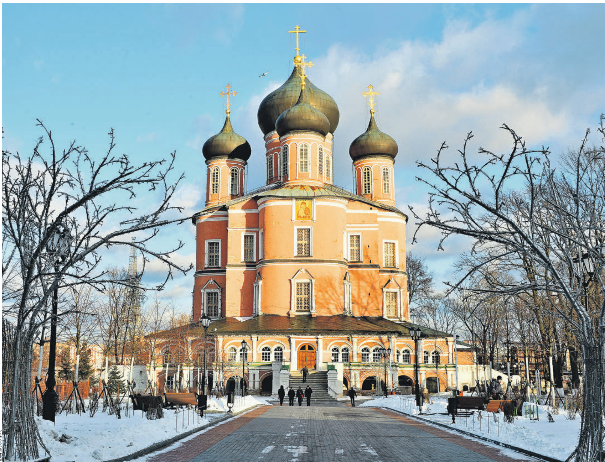
5 февраля 15:40 Соборный храм в честь иконы Богородицы Донского монастыря, озаренный лучами солнца, на фоне лазурно-голубого неба — редкий кадр для нынешней хмуро-пасмурной зимы