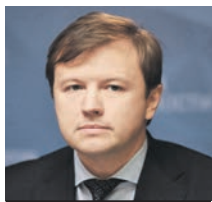
ВЛАДИМИР ЕФИМОВ ЗАМЕСТИТЕЛЬ МЭРА МОСКВЫ ПО ВОПРОСАМ ЭКОНОМИЧЕСКОЙ ПОЛИТИКИ И ИМУЩЕСТВЕННО-ЗЕМЕЛЬНЫХ ОТНОШЕНИЙ

В целом Москва окажет поддержку бизнесу на 70 миллиардов рублей, из них 23 миллиарда рублей направят на освобождение от платежей за аренду недвижимости, 22 миллиарда рублей — на отсрочки по налогам и платежам за землю и недвижимость, порядка 20–30 миллиардов рублей — на субсидирование ставки по кредитам для малого бизнеса.