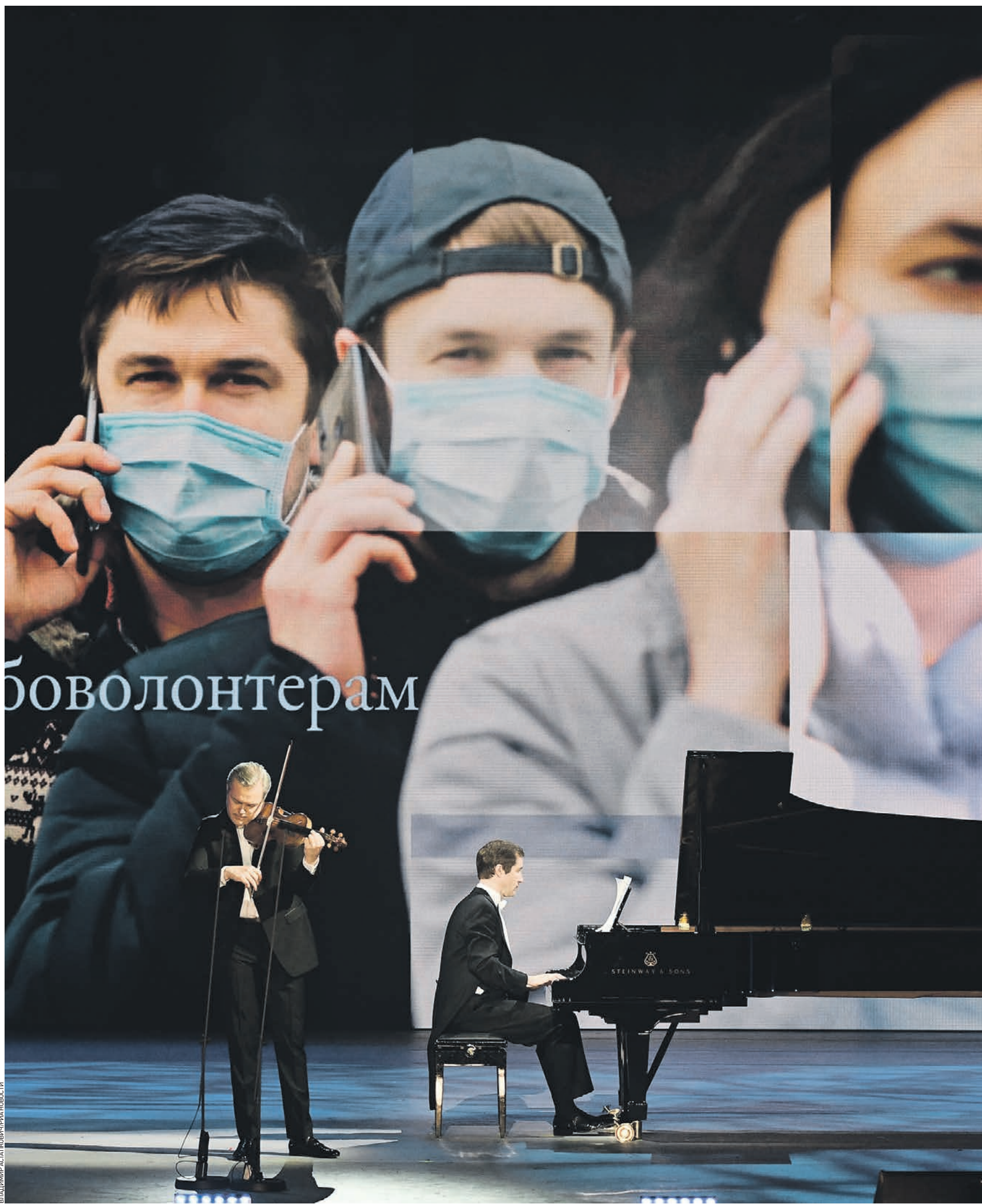
11 апреля 2020 года, Москва. Участники благотворительного концерта «Мы вместе» на сцене Большого театра. Концерт организован Большим театром и каналом «Россия 1»

— На самом деле режим ничегонеделания, который у нас установился, если вспомнить Конфуция, это режим продуктивный — нам не хватало времени для переоценки разных жизненных смыслов. И вот сейчас возникла ситуация, которую я по привычке проиллюстрировал бы анекдотом. Два человека ушли в яму, поднимаются, один другого спрашивает: «Ну, что теперь будем делать?» Второй качает головой: «Ну ты и трудолюбив, тебе и здесь нужно что-то делать!»