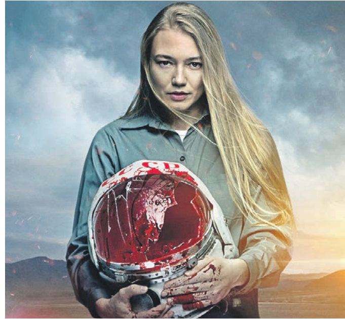
Актриса Оксана Акиншина исполнила одну из главных ролей в фантастическом фильме «Спутник»

Конечно, презентацию изначально задумывали провести в кинотеатре, чтобы режиссер мог пообщаться с публикой. Но жизнь внесла свои коррективы. Это станет возможным только после отмены режима всеобщей самоизоляции. Создатели картины отметили, что такой шанс появится, например, у тех, кто придет на фестивальные показы. По сюжету это фантастическое кино очень похоже на уже ставшего классикой «Чужого» Ридли Скотта. Но создатели «Спутника» внесли в него свои коррективы и перенесли действие во времена Советского Союза, а именно в 1983 год.