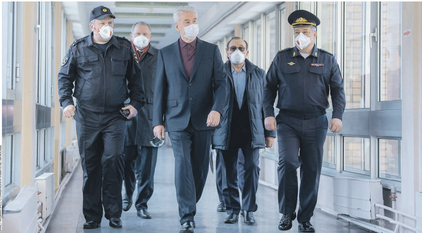
Вчера 11:00 (слева направо) Начальник госпиталя Сергей Мендель, глава Департамента здравоохранения Москвы Алексей Хрипун, мэр Москвы Сергей Собянин, заммэра Москвы по вопросам жилищно-коммунального хозяйства и благоустройства Петр Бирюков и начальник ГУ МВД России по Москве Олег Баранов на открытии стационара на базе Клинического госпиталя медико-санитарной части МВД России по городу Москве

день мэра Вчера мэр Москвы Сергей Собянин открыл стационар по борьбе с коронавирусом на базе Клинического госпиталя медико-санитарной части МВД России по Москве.