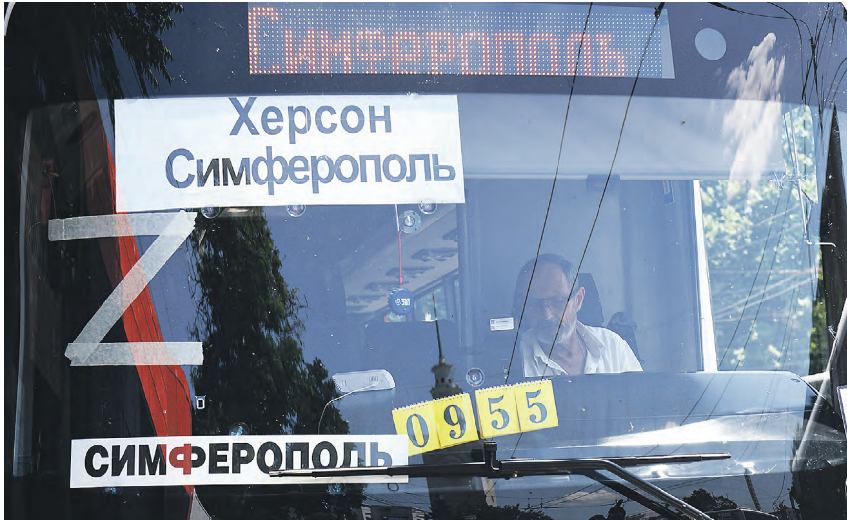
1 июля 2022 года. Водитель пассажирского автобуса, который выполняет рейс из Симферополя в Херсон. Транспортное сообщение между Крымом и освобожденным от националистов регионом восстановлено. Херсон возвратился к мирной жизни

Законспирированная группа базировалась в городе Бровары Киевской области. Результаты смертоносной акции боевики должны были докладывать лично президенту Украины Владимиру Зеленскому. Основной задачей диверсантов было создать в городе атмосферу паники и хаоса. А причиной теракта стало недовольство жителей Киева тем, что в Херсонской области сейчас восстановилась мирная жизнь. Диверсанты планировали устроить покушение на главу военно-гражданской администрации освобожденного региона Владимира Сальдо, его заместителя Кирилла Стремоухова и других сотрудников. Агентурную сеть возглавлял советник бывшего мэра Херсона, а также несколько приближенных к нему сотрудников. Глава Чечни Рамзан Кадыров заявил о том, что необходимо добить сбегавших из Чечни на Украину террористов. — Для нас, чеченцев, спецоперация еще далека до завершения. Мы отчаянно надеемся, что нам дадут возможность пойти, если надо, до Киева и добить остатки террористов, сбегавших в свое время из Чеченской Республики. Эти крысы находятся в розыске. Мы