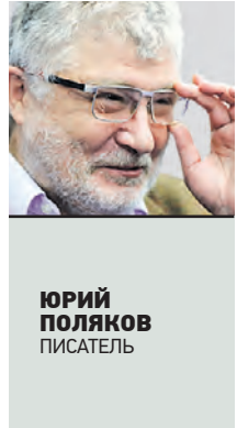
ЮРИЙ ПОЛЯКОВ ПИСАТЕЛЬ

...Однажды на литературной встрече в столице пива Праге ко мне подошел соотечественник, похожий скорее на преуспевающего бизнесмена, нежели на человека, изнуряющего себя муками словосложения. Он смущенно попросил посмотреть и оценить его рассказы. Должен заметить, с такими просьбами ко мне обращаются часто, и я никогда не отказываюсь — беру у авторов заветный сборник стихов, изданный за свой счет, пухлую рукопись прозы или флешку с эпопеей. Увы, как правило, сочинения эти не поднимаются выше упорной любительщины с про-