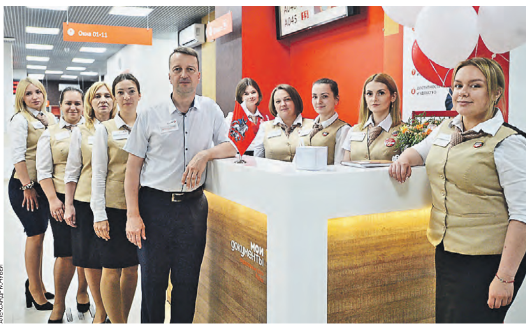
5 июля 11:25 Сотрудники нового центра госуслуг «Мои документы», который расположен по адресу Игарский проезд, 8, встречают посетителей

Так, с 1 июля граждане нашей страны могут подать заявление о регистрации по месту жительства или по месту пребывания в Москве в любом центре госуслуг. Также российский паспорт оформят там в течение пяти рабочих дней с момента поступления документов в отдел миграции. Ранее срок составлял десять дней для москвичей и 30 — для горожан, зарегистрированных в других регионах России. Кроме того, сотрудники центров госуслуг примут документы при достижении 14, 20 и 45 лет, смены имени, непригодности па-