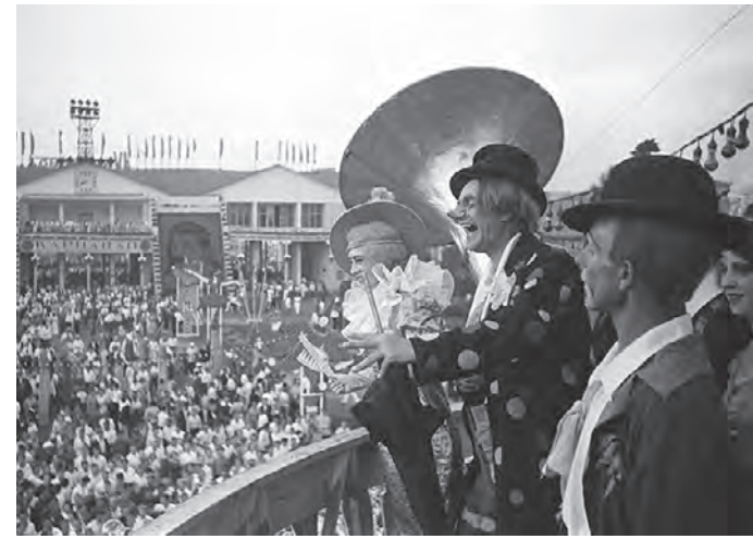
30 июня 1938 года. Карнавальное представление в Центральном парке культуры и отдыха имени Горького

— Регулярные занятия летом проходят в 18 крупных городских парках. Больше 30 тысяч москвичей старшего поколения смогут заниматься скандинавской ходьбой, гимнастикой, йогой, цигун, футболом,