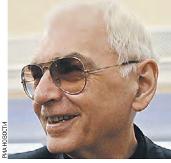
Карен Георгиевич, как планируете отметить 70-летие? С каким настроением встречаете юбилей?

Сегодня кинорежиссеру, продюсеру, сценаристу, народному артисту России и генеральному директору киноконcerna «Мосфильм» Карену Шахназарову (на фото) исполняется 70 лет. Режиссер рассказал «ВМ» о том, как отметит день рождения и как сейчас живет современный российский кинематограф.