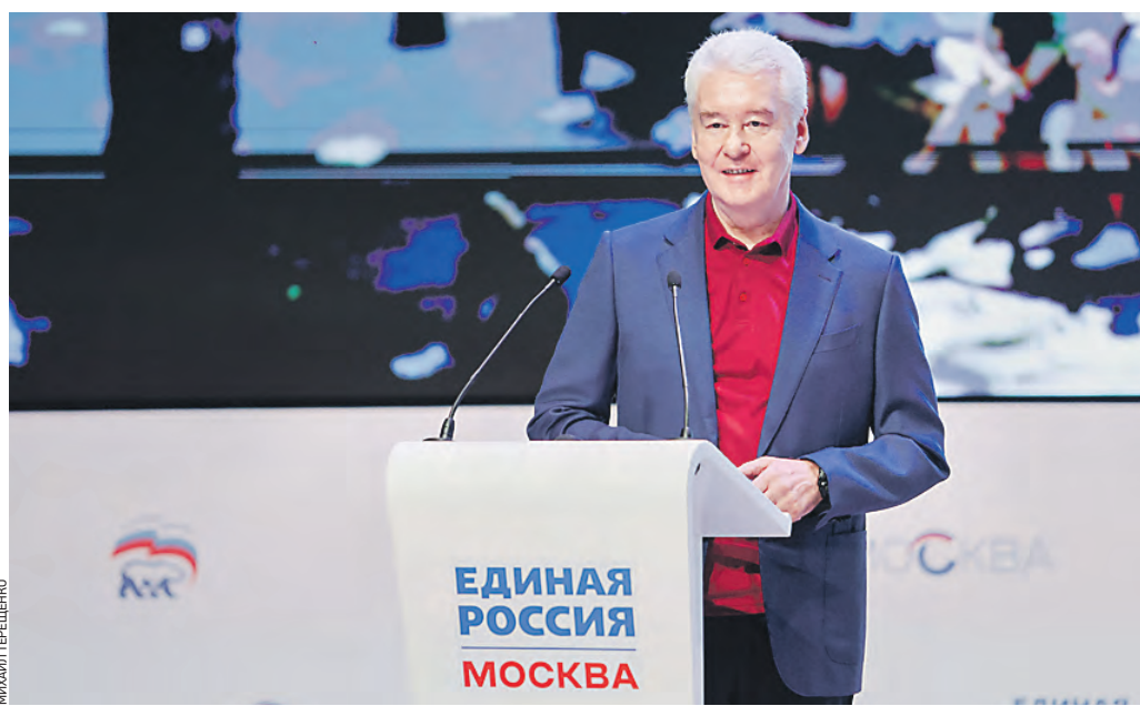
13 июня. Мэр Москвы Сергей Собянин принял участие в XXX Конференции Московского городского регионального отделения партии «Единая Россия»

— В таких условиях мы боремся за военную победу, политическую стабильность и экономический суверенитет, — продолжил глава города. Он подчеркнул, что Москва сегодня — оплот всей страны. Это касается и оборонной