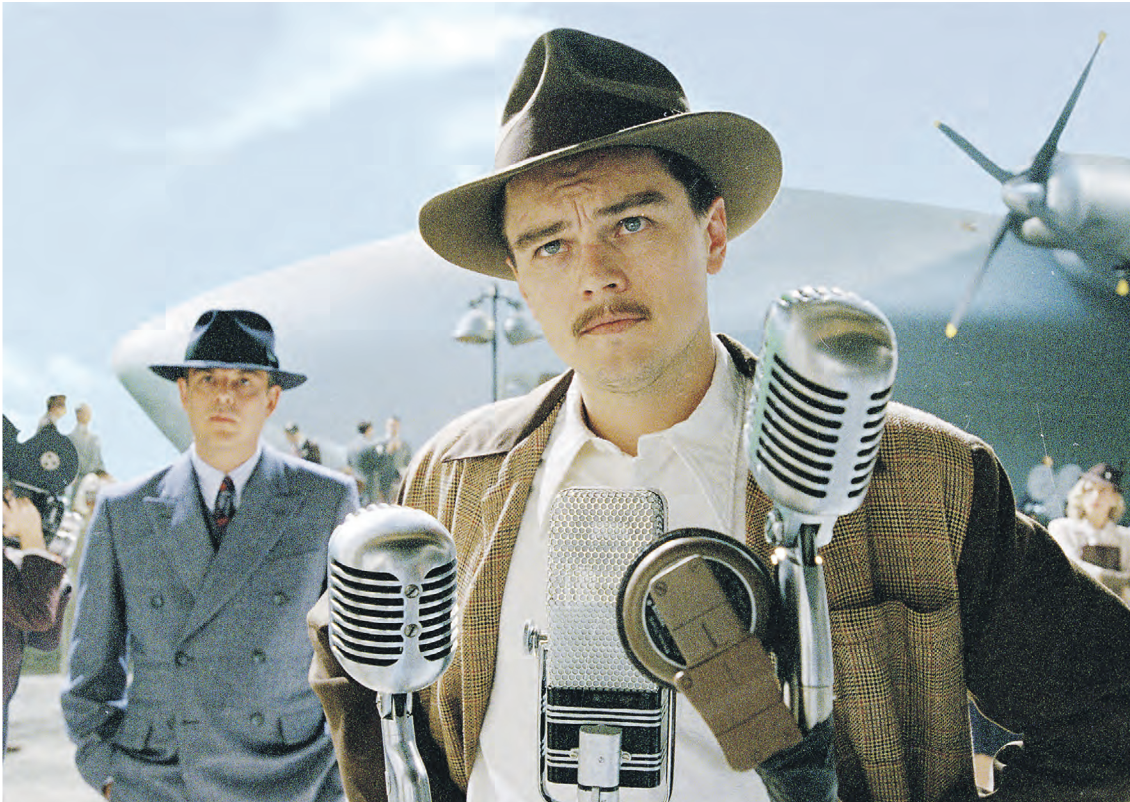
Герой картины «Авиатор» 2004 года Говард Хьюз (в исполнении Леонардо Ди Каприо) — эталонный достижатель. Он счастлив только в небе, где все решает его мастерство, но итогом всех его достижений становятся разочарования

Почему специалисты говорят, что достижатели ставят на кон свои жизни