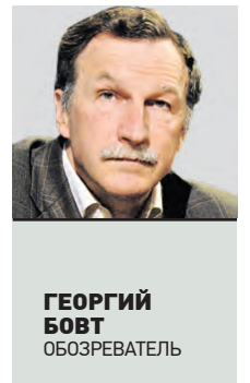
ГЕОРГИЙ БОБТ ОБОЗРЕВАТЕЛЬ