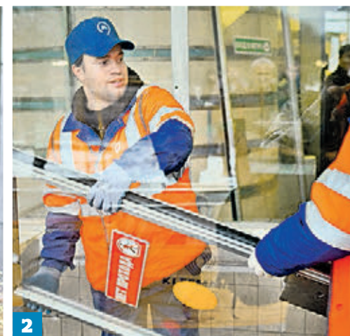
Агентство городских новостей «Москва»

■ На Филевской линии Московского метрополитена начался капитальный ремонт станций. Для удобства столичных пассажиров работы проведут в несколько этапов.