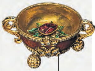
Чарка Петра I

«Вечерка» подобрала самые интересные экспонаты выставки. Такую роскошь встретишь не часто!