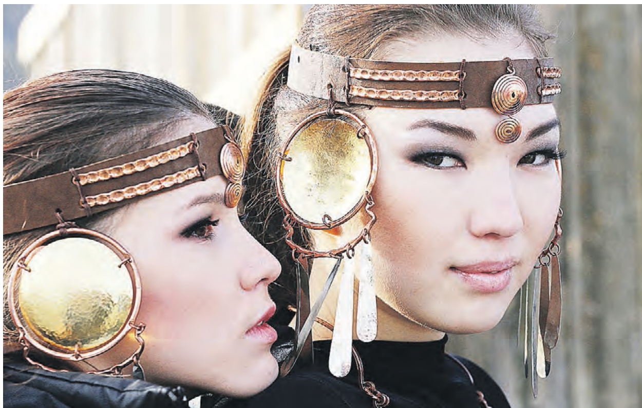
► 2016 год. Фестиваль «Ердынские игры» на Байкале. Фотография — финалист конкурса «Самая красивая страна»

■ Масштабный фестиваль, посвященный народам России, стартует в столице 3 ноября. Он объединит путешественников, любителей этноса и фольклора со всех уголков страны.