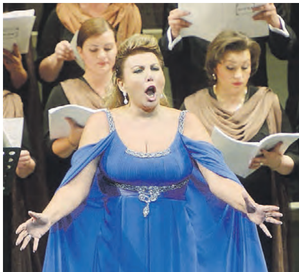
► 17 июля 2013 года. Фестиваль «Звезды белых ночей». Мария Гулегина на сцене Мариинского театра

выступлением народного ансамбля казачьей песни «Славица» из Краснодарского края. Затем последует церемония награждения победителей фотоконкурса «Самая красивая страна». А в последний день работы фестиваля, 12 ноября, гостей ждет увлекательная лекция «Свадьбы народов России: национальное культурное наследие». Фестиваль будет ждать гостей до 12 ноября с 11:00 до 20:00.