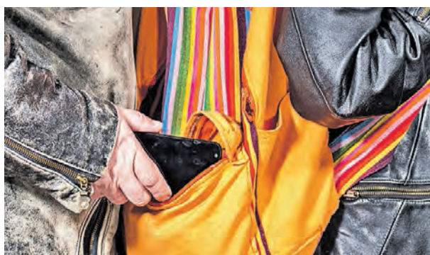
►Шустрый карманник за 20 минут умудрился «обчистить» половину автобуса

Воспользовавшись давкой в автобусе, карманник за 20 минут умудрился вытащить у пассажиров пять дорогих смартфонов разных марок. «Чистая прибыль» шустрого ворюшки оценивается в 155 тысяч рублей. Столичные полицейские предполагают, что злоумышленник зашел в транспорт на остановке «Динамо» и вышел у «Авиапарка». На руку предприимчивому вору сыграл час пик — из-за давки пострадавшие попросту не заметили, как их обокрали. Возбуждено уголовное дело, подозреваемый не найден. Остается только надеяться, что, пока сотрудники правоохранительных органов ищут виновного, он не успеет лишиться телефонов всю Москву, а то немудрено — с такой-то скоростью.