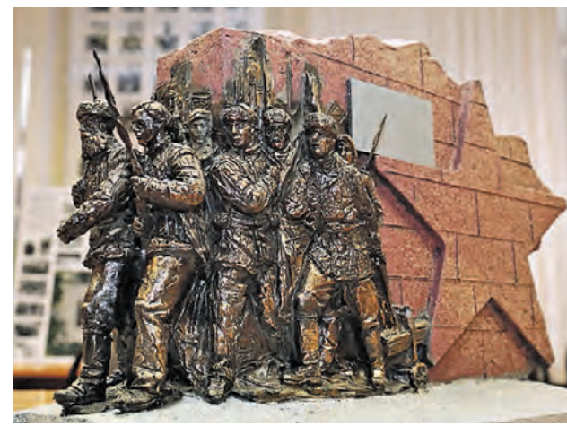
► Макет памятника дивизиям Московского народного ополчения

000 «Центр МРТ-О», ИНН 7719218866, ОГРН 1027700140335 Реклама