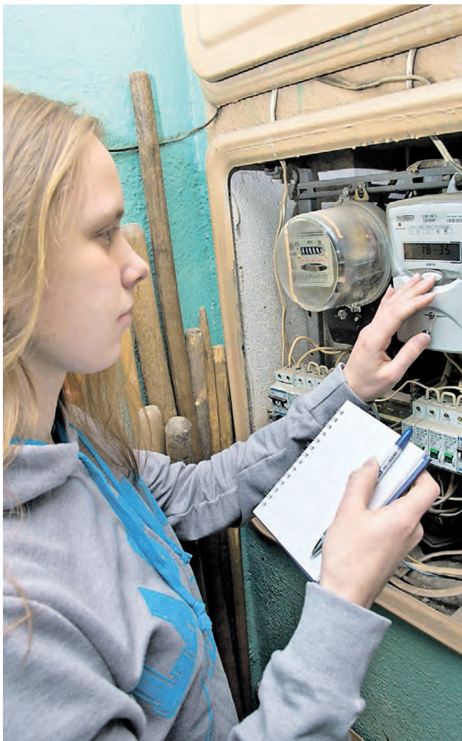
► 21 января 2016 года. Москвичка снимает показания многотарифного электросчетчика