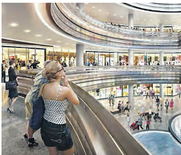
► Проектное решение многофункционального торгового центра на Каширском шоссе