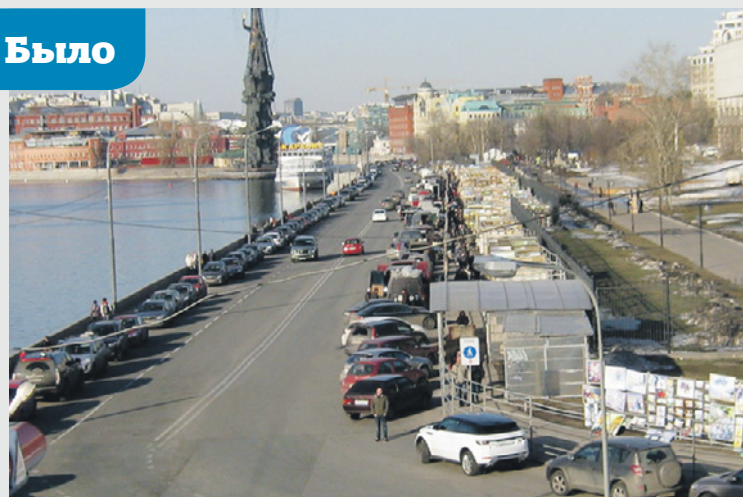
До реконструкции Крымская набережная напоминала скорее стихийную парковку