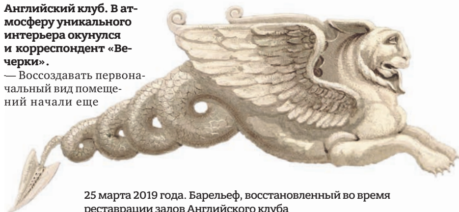
25 марта 2019 года. Барельеф, восстановленный во время реставрации залов Английского клуба