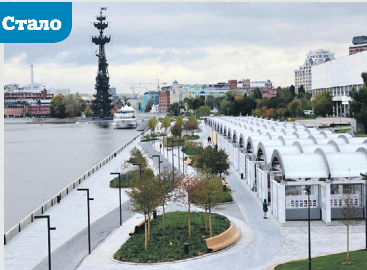
Крымская набережная делится на четыре зоны: пространство под мостом, зона художников, Фонтанная площадь и Зеленые Холмы