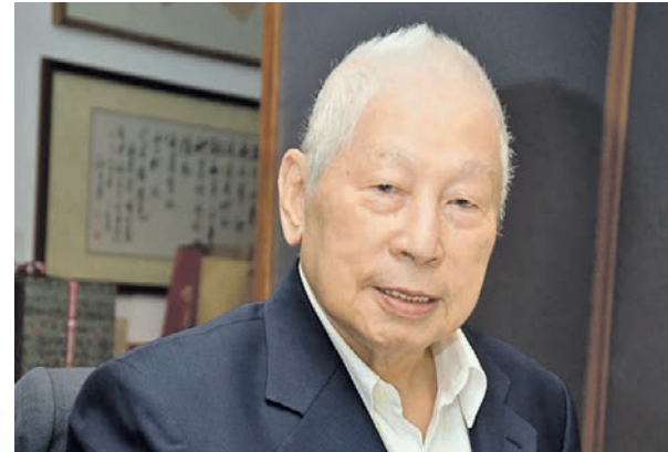
Чан Юн Чун каждый день посещал офис и контролировал работу до самой смерти

■ Самым старшим миллиардером мира до последнего времени считался Чан Юн Чун из Сингапура.